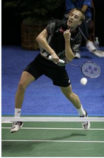
Danimarkalı Olimpik tüytop oyuncusu Peter Gade